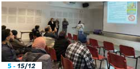
5 - 15/12