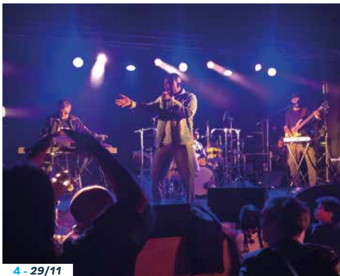
4 - 29/11