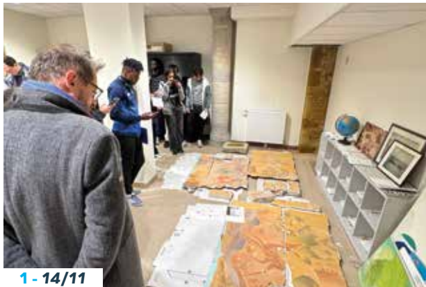
1 - 14/11