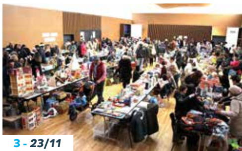
3 - 23/11