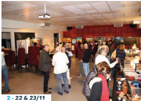
2 - 22 & 23/11