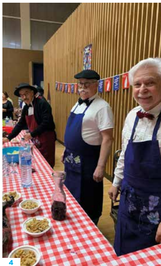
1 — Inauguration EHSP (octobre 2022). 2 — CME visite de la base aérienne 942. 3 — Très belle soirée Halloween à la salle du Lavoir (octobre 2022) 4 — Salon vins & saveurs (novembre 2022).