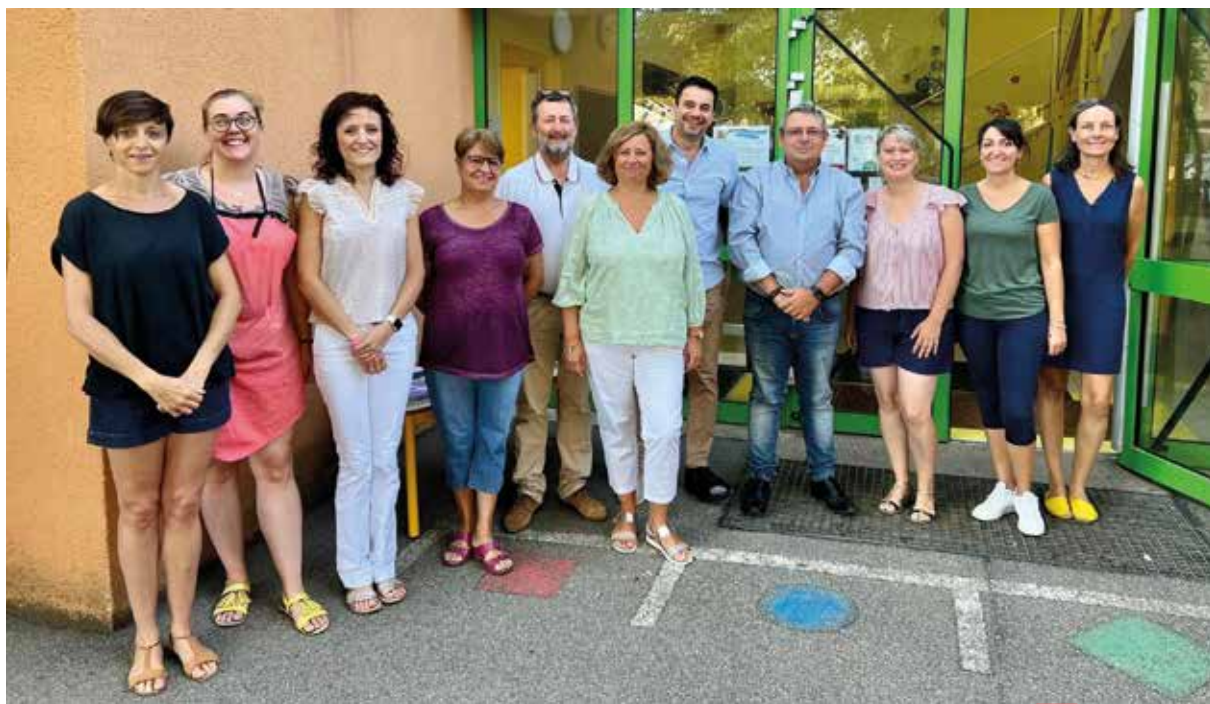
l'équipe de l'école maternelle