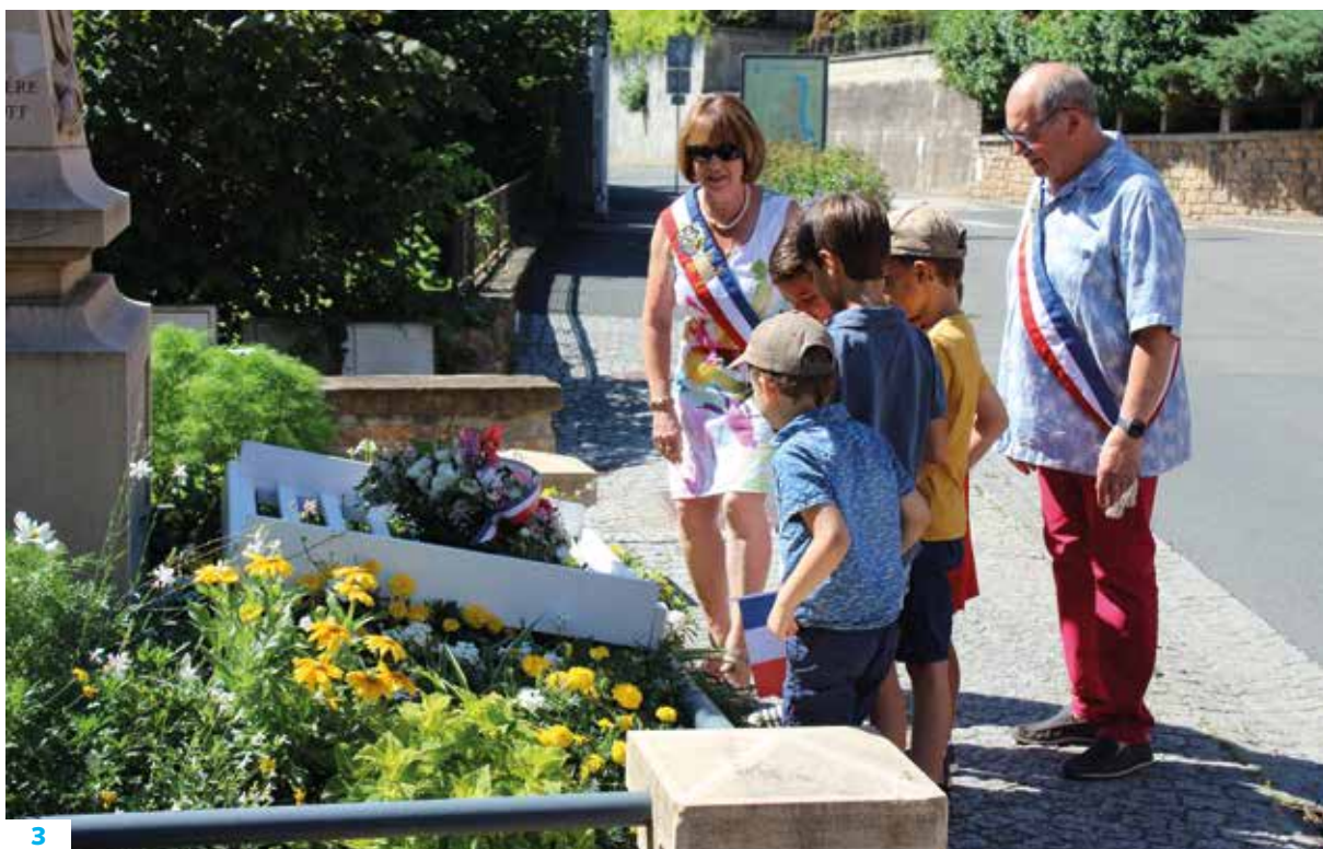
1 — Remise livres aux CM2. 2 — Forum des associations. 3 — Cérémonie du 14 juillet.