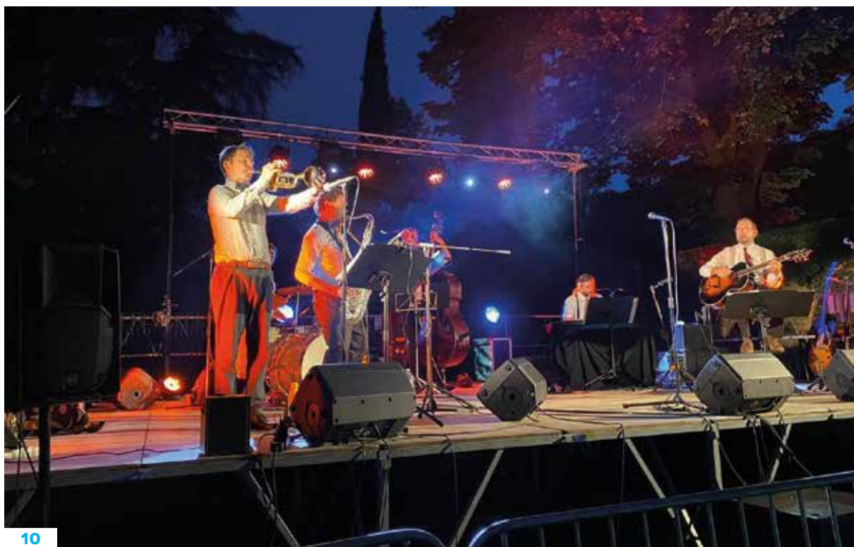
8 — Kermesse de l'école. 9 — Fête de la musique. 10 — Festivités du 14 juillet.