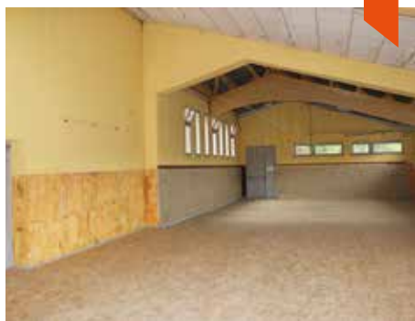
Travaux de réaménagement de l'EHSP en cours de réalisation.