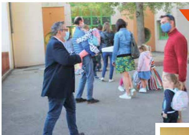
Le Maire à la rencontre des enseignants, des parents et des enfants de l'école des Frères Voisin, le jour de la rentrée scolaire.