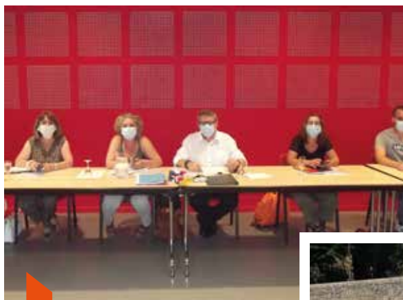
Le nouveau Conseil municipal en séance.