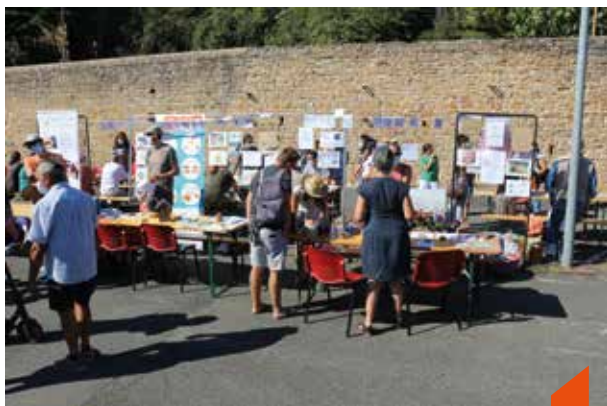
Forum des associations / Rencontre entre Albignolais en quête de sports et de loisirs et représentants des associations de la commune.