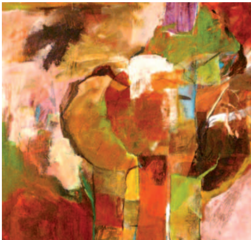
Œuvre acquise par la Mairie en 2008

Le prochain appel à candidatures pour l'édition 2013 sera lancé entre mars et décembre 2012. La sélection effectuée par un jury donnera à de nouveaux artistes l'occasion de se retrouver à l'Espace Henri Saint-Pierre et permettra à toute forme d'art de venir à la rencontre de la population ▮