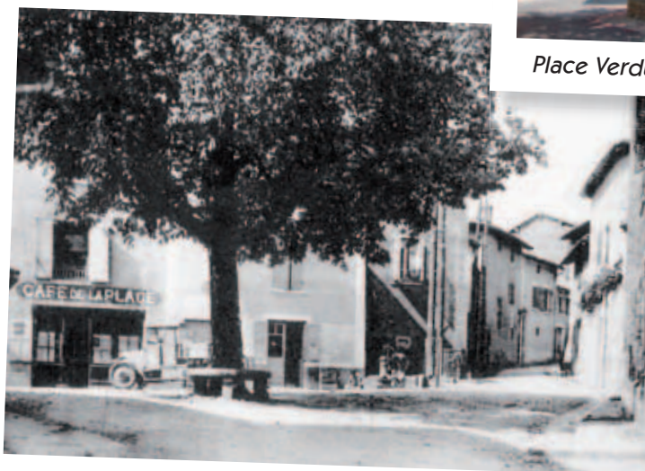
Place Verdun au début du XX e siècle