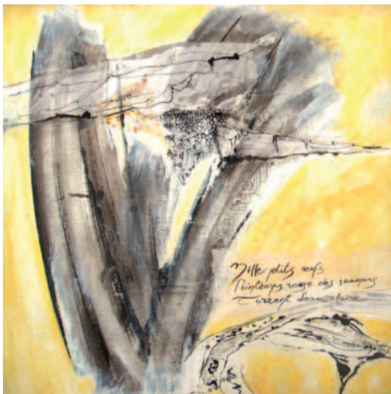
Œuvre acquise par la Mairie en 2010