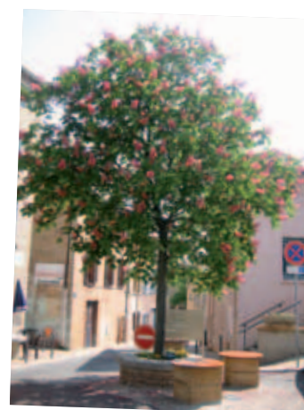
Place Verdun de nos jours

Il est parfaitement à sa place devant le « CAFÉ DU MARRONNIER CENTENAIRE » qui perpétue le souvenir de son prédécesseur ▮