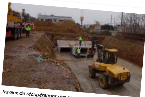
Travaux de récupérations des eaux pluviales des voiries