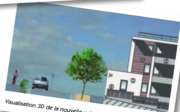
Visualisation 3D de la nouvelle voie