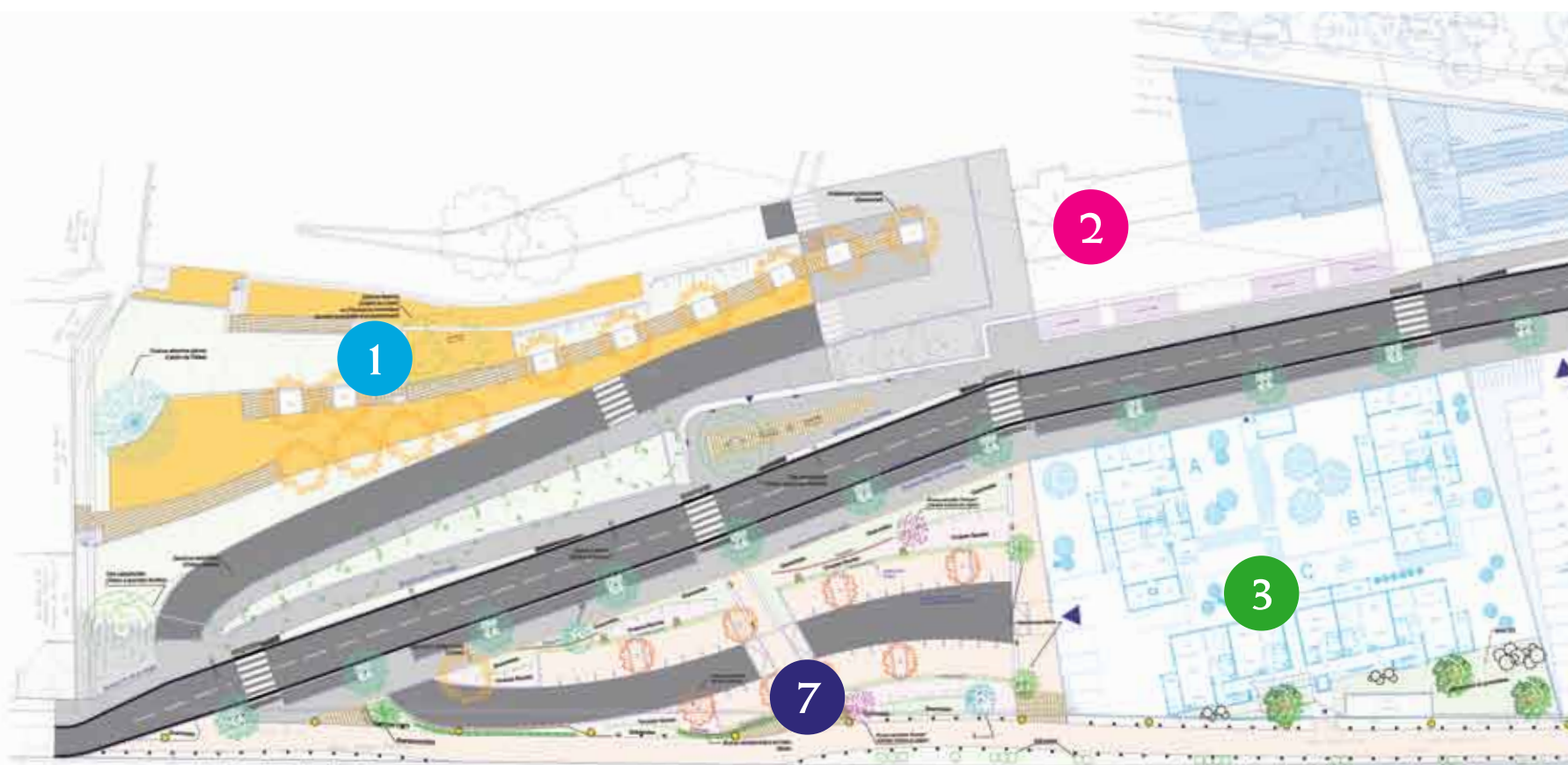
Plan de la nouvelle voirie

L es travaux actuellement en cours sur la phase 1 vont permettre de réaliser un ensemble fonctionnel, agréable et équilibré, entre circulation, stationnement, logement et activité.