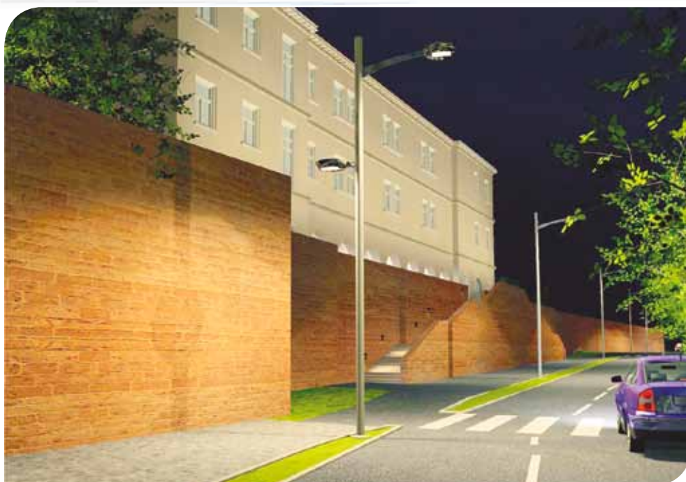
Maison des associations