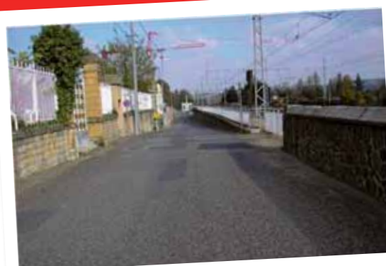
Passage de cette partie de la rue Jean Chirat en mode doux

Le projet de restructuration du « centre bourg » se terminera par la construction d'environ 70 logements collectifs avec locaux d'activité et peut-être quelques commerces supplémentaires.