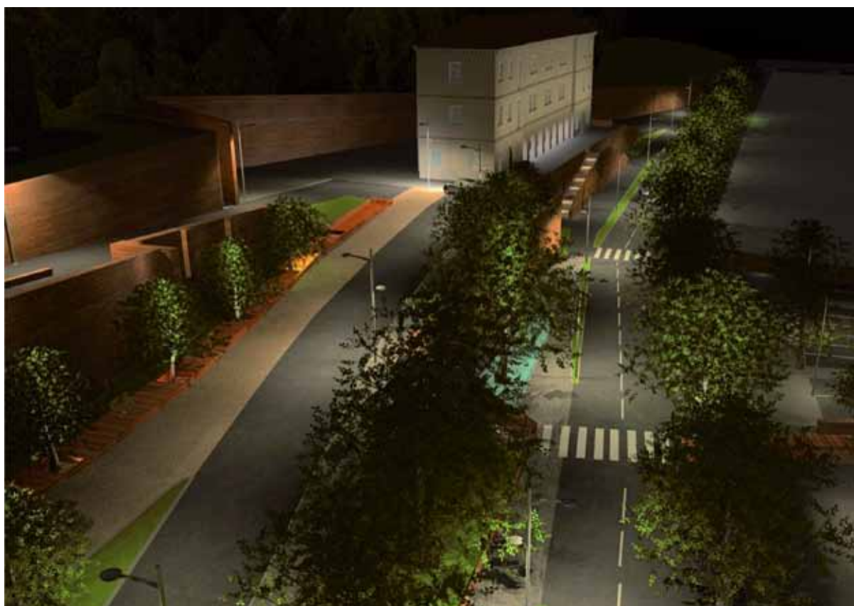
Visualisation 3D de la Maison des Associations