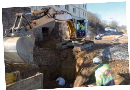
Les ouvriers s'affairent sur le chantier