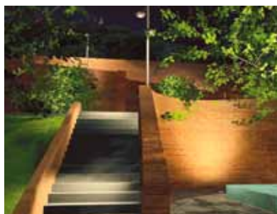
Visualisation 3D de l'escalier après travaux