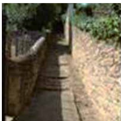
Escalier existant qui sera remis en état