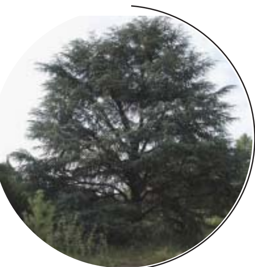
Les beaux arbres comme ce cèdre seront préservés