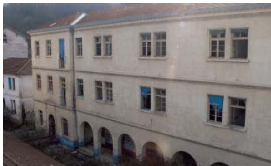
L'ancien cloître du CLMS sera préservé et mis à disposition des associations

Vous pouvez le faire par téléphone au secrétariat de la mairie : 04 78 91 31 38 ou par mail : gc@mairie-albignysursaone.fr