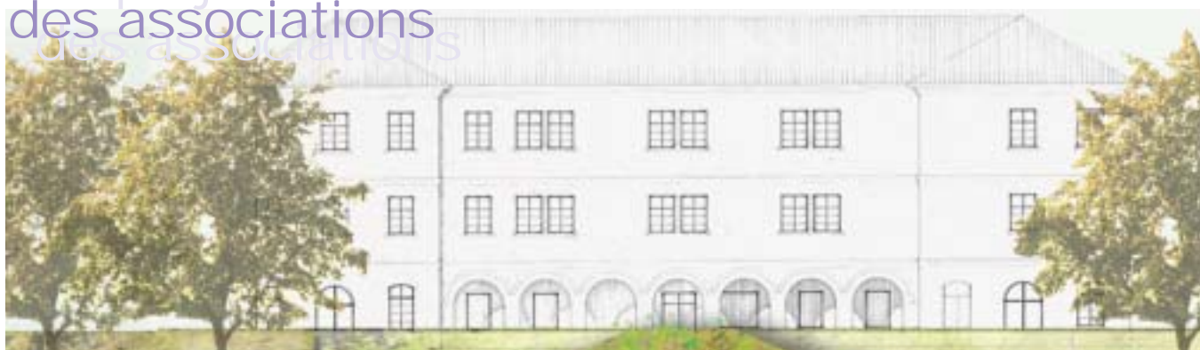
L'ancien cloître dans son état actuel représente une surface de plancher de près de 1200m 2 (sur 3 niveaux). Il sera réservé en grande partie aux associations de notre commune.