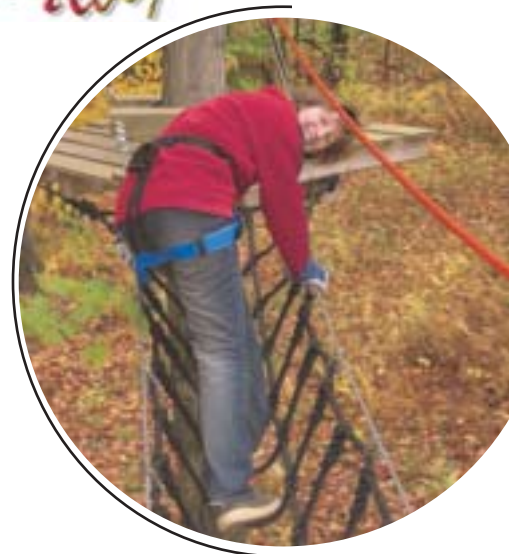
Vendredi 8 juillet : parc acrobatique forestier (11-18 ans, 10 jeunes minimum) : 9€