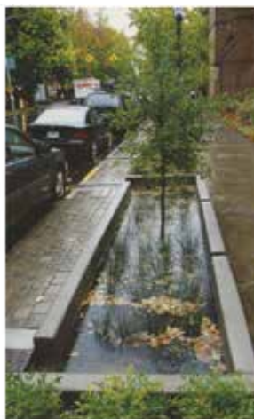
Les jardins de pluie

Le principe des jardins de pluie est simple : ralentir l'absorption des eaux de pluie avec un mélange d'argile de limon et de sable sous le lit des jardins.