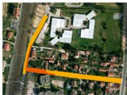
construction du projet

les eaux pluviales qui passent par les égouts arrivent dans les rivières et sont néfastes pour la faune aquatique. De plus, en cas de gros orages, les égouts sont vite sursaturés et peuvent causer de gros problèmes en surchargeant les stations d'épuration. Alors que dans un milieu naturel, les eaux de pluies s'infiltreraient lentement dans le sol