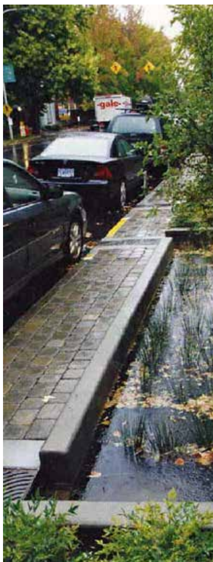
Les futurs jardins de pluie de la rue Zipfel